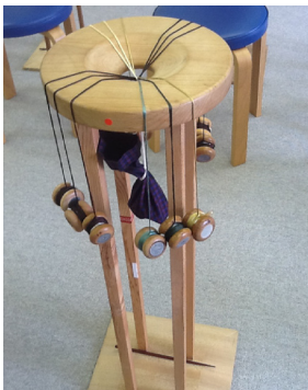
ストラップをつくって

日時 平成26年7月19日(土) 場所 株式会社道明 参加人数 31名 内容 丸台を使ってのストラップの作製体験