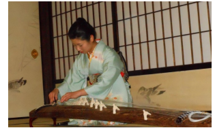
応挙館でのお箏と踊り