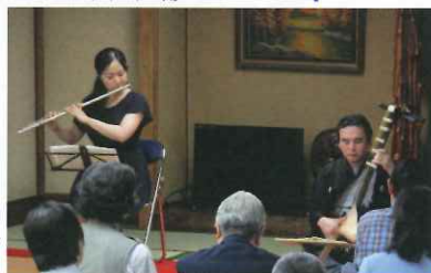
第 2 回例会・ 琵琶とフルートの 演奏