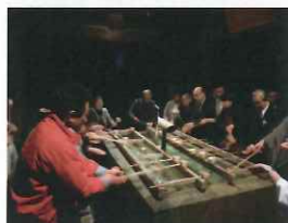
賑やかに 行われた交流会