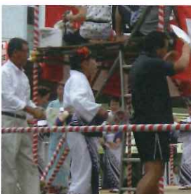
幼い頃に踊った 盆踊りを再体験

日 時 平成 25 年 8 月 24 日 (土) 場 所 盆踊り会場 京王線・京王井の頭線 明大前駅前広場 講演会場 昭和信用金庫 2 階会議室 東京都世田谷区松原 2-44-2 参加人数 25 名 内 容 盆踊り (文化倶楽部貸切) 講演 「お盆と盆踊りと風の盆」 講師 日本芸能学会会長 三隅治雄氏