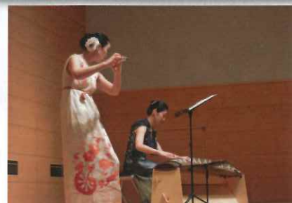
フルートと琴の演奏が心に響く