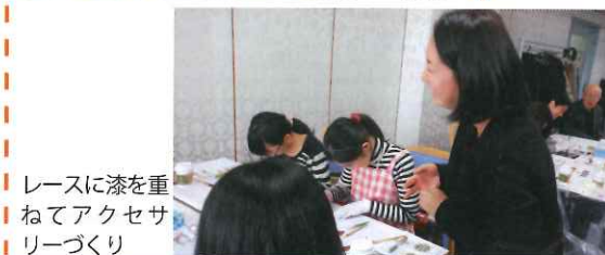
レースに漆を重ねてアクセサ リーづくり