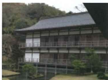
第 1 回例会・建長寺 庭園と建物

日 時 平成 25 年 1 月 19 日 (土) 場 所 鎌倉 建長寺 参加人数 70 名 内 容 講話 建長寺僧侶による お正月遊び 福笑いとおカルタ 呈茶 (お抹茶) 建長寺非公開文化財 特別見学 ・虚無僧尺八 (中村明一氏) ・尺八とギター (吉田光彦氏) ベース (グレッグ・リー氏) のトリオによる尺八ジャズ演奏 「和と洋のくらべ」