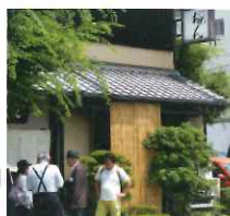
昼食は、銀閣寺門 前の「おめん」で